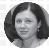
VĚRA JOUROVÁ Commissioner for Justice, Consumers and Gender Equality, European Commission