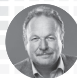
FRANK BSIRSKE Vorsitzender, Vereinte Dienstleistungsgewerkschaft (ver.di)

Paulskirche, Frankfurt am Main 15. November 2018